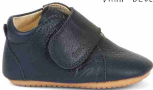
G1130016 DARK BLUE