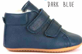
G1130013-2 DARK BLUE