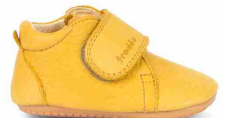
G1130016-6 DARK YELLOW