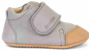
G1130015-5 LIGHT GREY