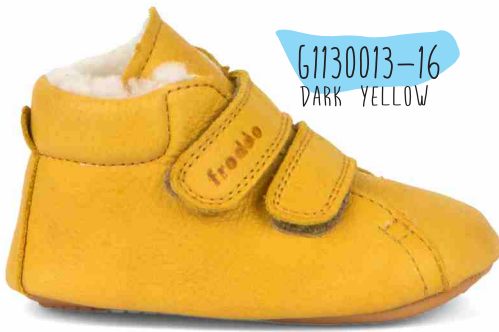
G1130013-16 DARK YELLOW