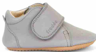
G1130016-5 LIGHT GREY