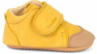
G1130015-6 DARK YELLOW