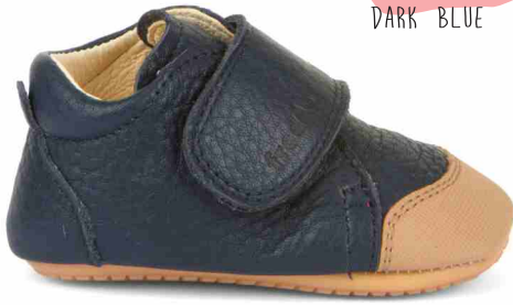
G1130015 DARK BLUE